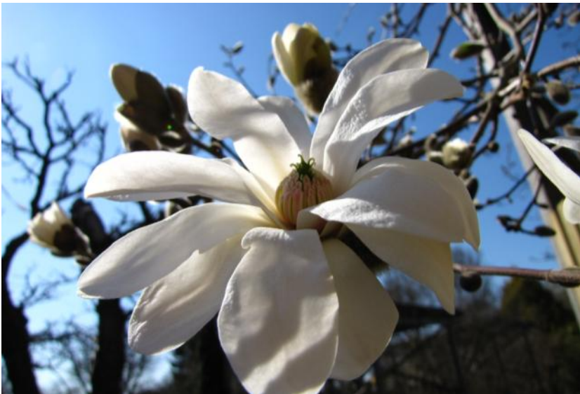
M. Stellata x Ballerina