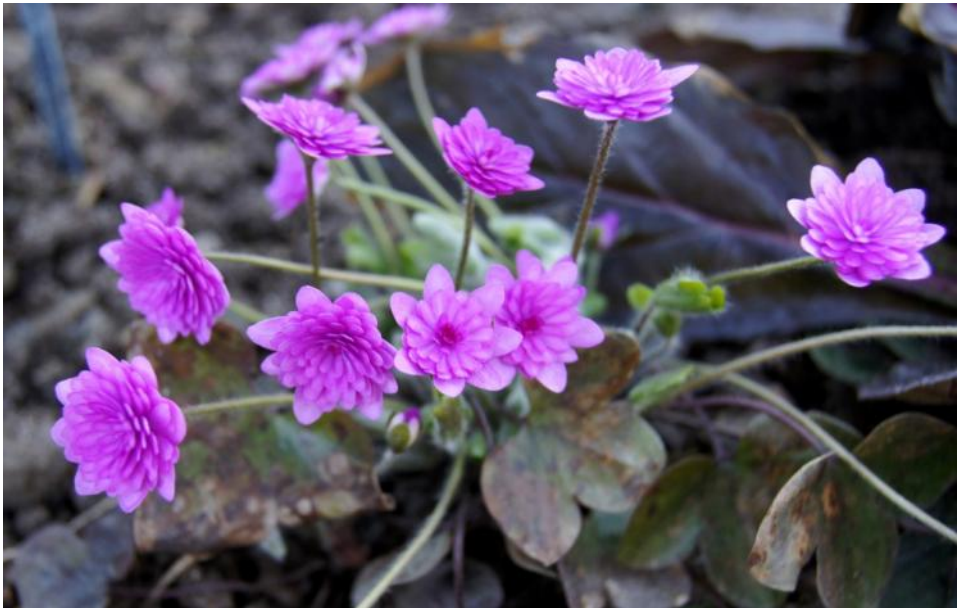
Hepatica nobilis 'Rubra Plena'