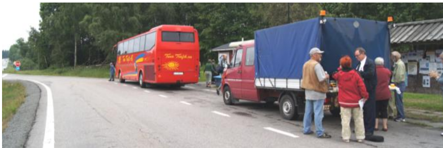
Fikapaus, bensträckare... och bussen med följebil

Resan startade som de senaste gångerna från Örnborgens i Hällbybrunn, Eskilstuna kl 7.30 den 2 juli. Det var en fullsatt buss som åkte iväg med förväntansfulla resenärer. Efter ett par timmars åktid och en del försiktig prat i bussen hade vi vårt första stopp, där vi intog vårt medhavda fika. Det var skönt att sträcka på benen och få lite frisk luft i det behagliga vädret.