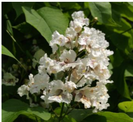
En blommande Catalpa