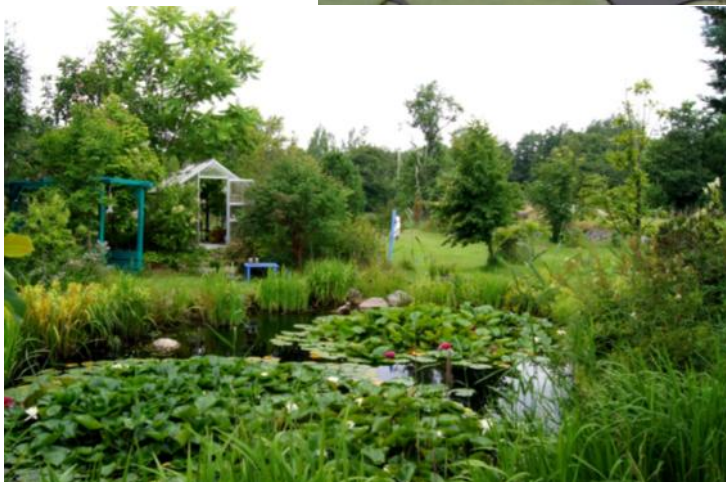
Vy över en del av dammarna och arboretet